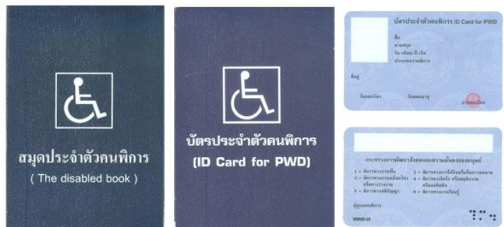
ตัวอย่างบัตรและสมุดประจำตัวคนพิการ

กรณีได้รับเบี้ยยังชีพคนพิการอยู่แล้ว และได้ย้ายเข้ามาในพื้นที่ตำบลสมอพลือ จะต้องมาขึ้นทะเบียนที่ อบต.สมอพลือ อีกครั้งหนึ่งภายใน ๑-๓๐ พฤศจิกายน เพื่อใช้สิทธิรับเงินเบี้ยยังชีพต่อเนื่อง.....ค่ะ